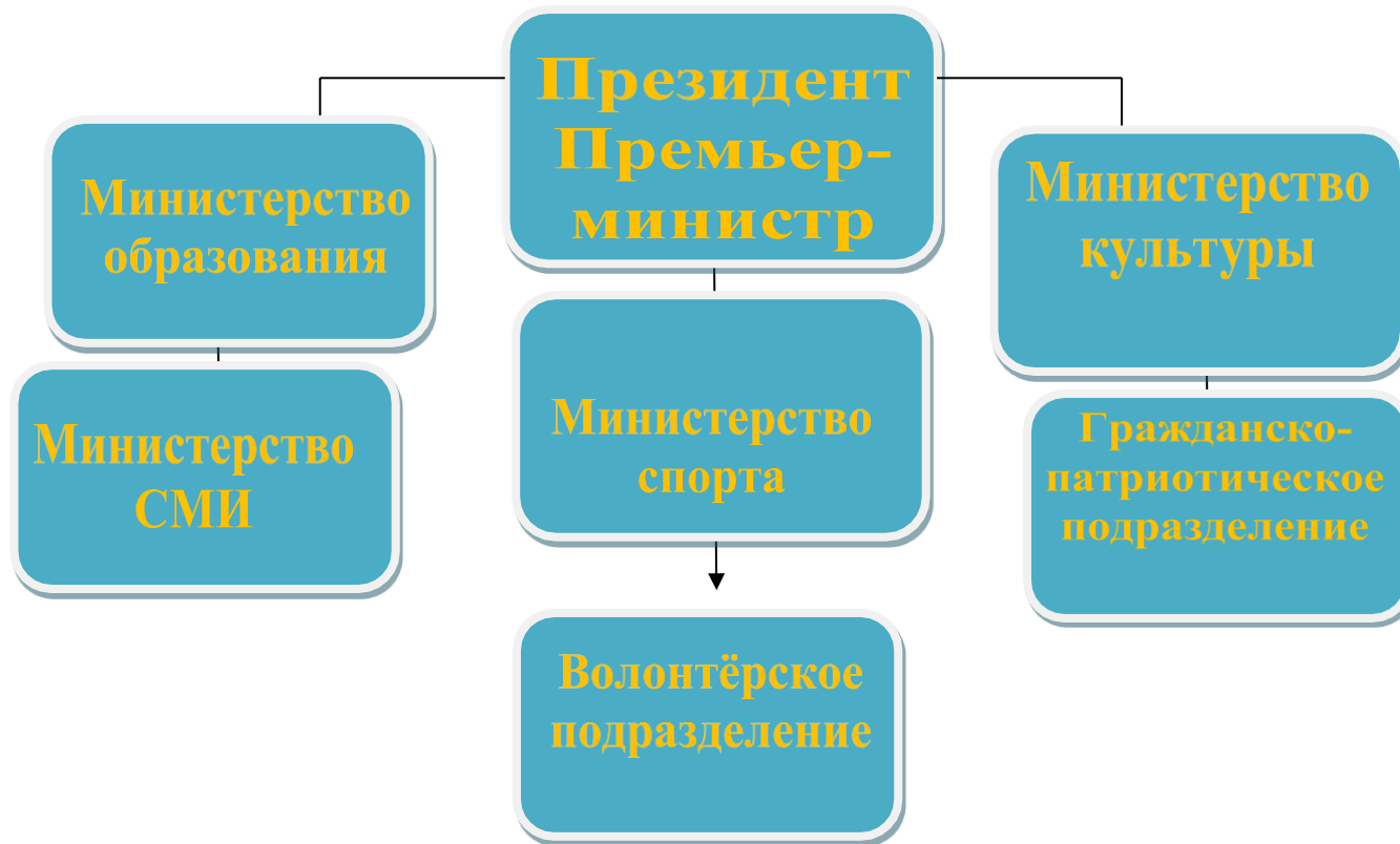
Схема органа самоуправления

Совет Старшеклассников является представительным органом ученического самоуправления.